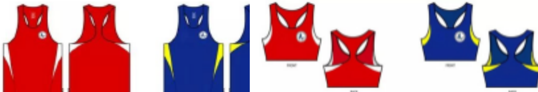
Femminile (fig. 2)

Pantaloncini come da disegno, per tutti, oppure colore NERO per entrambi gli atleti (fig. 3)